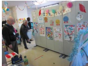
, èóí# ³> f