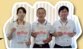
移動情報センターコーディネーター

障害をもった方の移動に 関する相談窓口です。 人材育成のための講座も 開催しています。