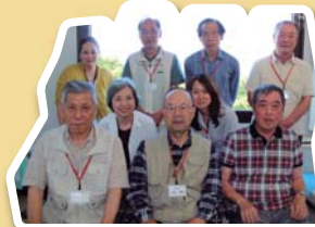
送迎コーディネーター&送迎ボランティア「葦の会」メンバー

「頼んでよかった」と思っ ただけの送迎に努めています。 運転ボランティア募集中! ご利用についてもお気軽に お問い合わせください。