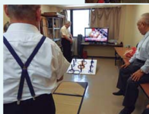
輪投げの腕前はプロ級