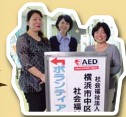
ボランティアコーディネーター