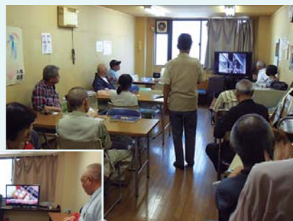
カラオケは大人気!

なっていた人たちに外出の機会や他の人と交流する機会をもってもらいたいという強い思いから始まりました。地域とのつながりを感じながら、リラックスした気楽な空間のなかで回を重ねていくと共に参加者同士やボランティアとの交流も深まってきました。