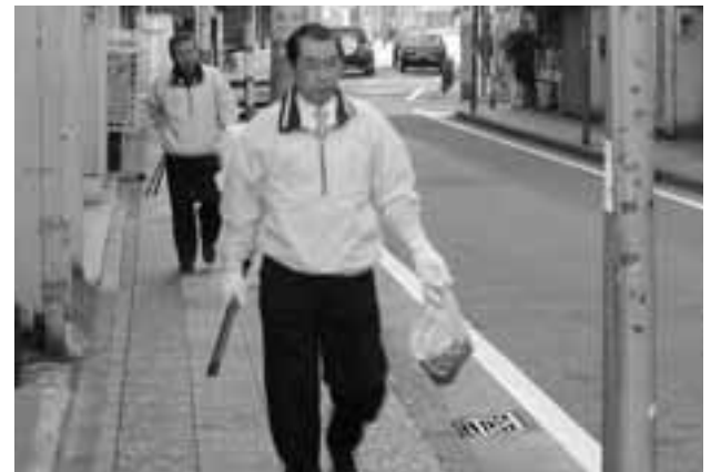
小さなゴミも見逃しません!