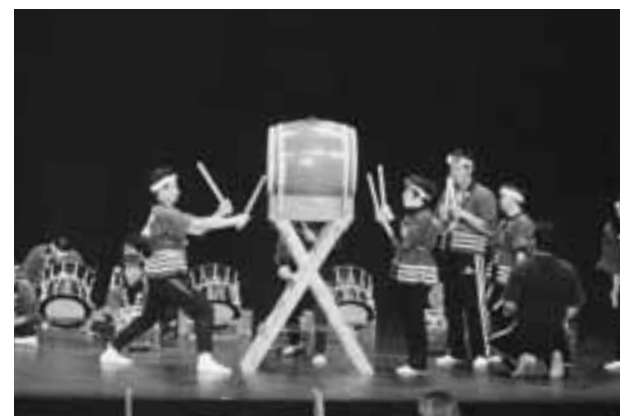
聖坂養護学校の聖太鼓