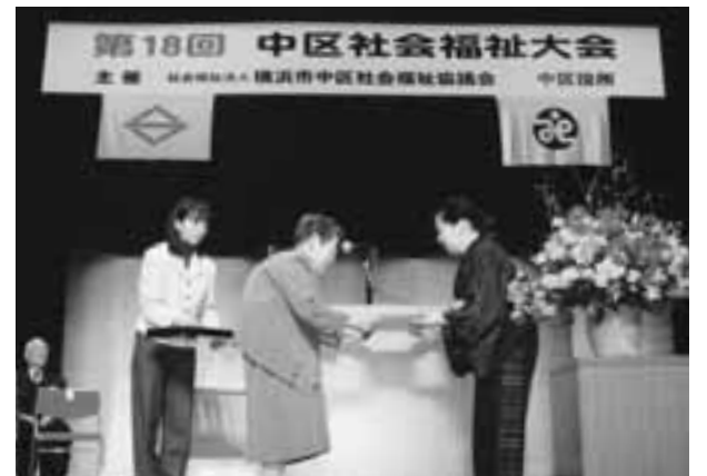
中区社協大澤会長より表彰者の方へ