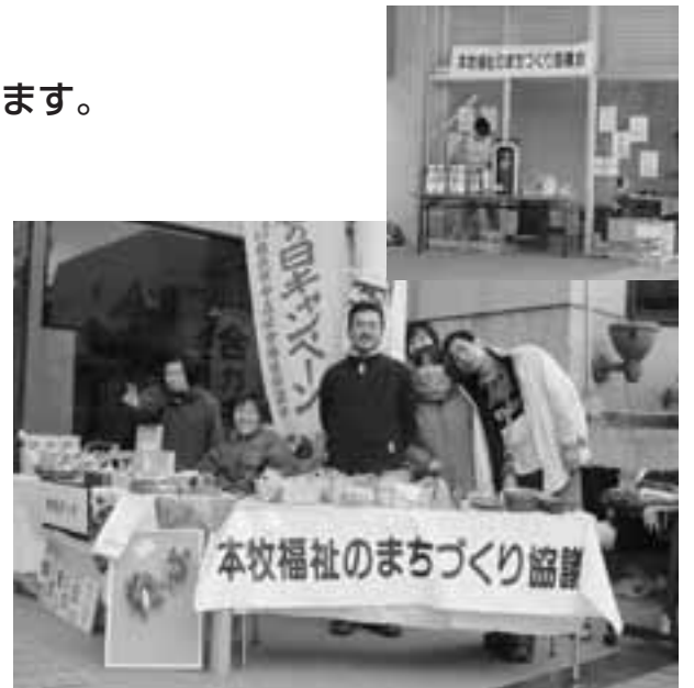
寒さにも負けず元気に販売!

また、3月22日からは、毎週土曜日に本牧山頂公園管理棟でも自主製品の販売を始めています。是非お越し下さい!