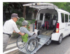
送迎車両が新しくなりました

中区社会福祉協議会では、公共交通機関の利用が困難な高齢者、障害者の外出を支援する送迎サービスを行っています。その送迎車両を運転していただくボランティアを募集しています。詳しい活動内容・活動日等については、下記までお気軽にお問い合わせください。