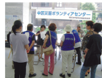
ボランティア希望者へ登録用紙の記入方法を説明

今回は、大地震発生後を想定して、ボランティアの受付から、依頼先へのボランティアの派遣などを中心に行いました。