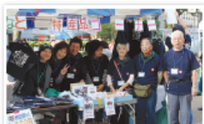
笑顔でお待ちしています!

10・11月の区内で行われるイベントでさんりくの特産品や応援Tシャツ、電車の忘れ物傘などを販売します。販売収益金は“被災地花いっぱい運動”の活動に役立たせていただきます。ぜひお越しください!(横浜高速鉄道様にご協力いただいています)