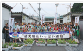
大船渡市内の仮設住宅にて

仮設住宅の入居者のみなさんと一緒に、大船渡市の障害者福祉施設で育てたニチニチソウやサルビアなどのポット苗をプランターに植え替える作業を楽しみながら取り組みました。