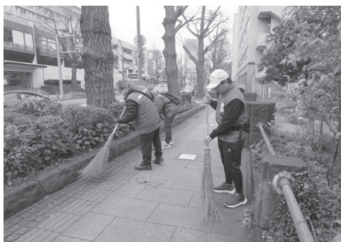
株式会社キョクレイ