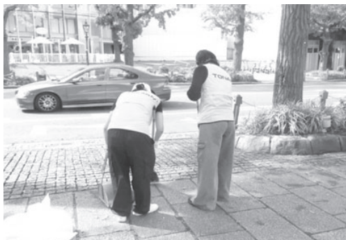
トナミ国際物流株式会社

ボランティア団体等と共催で毎月第3土曜日に開催している「月1回ちょいボラに挑戦 山下公園通り清掃活動」プログラムに、今年度は2企業（トナミ国際物流株式会社、株式会社キョクレイ）の皆さまにご参加いただきました。